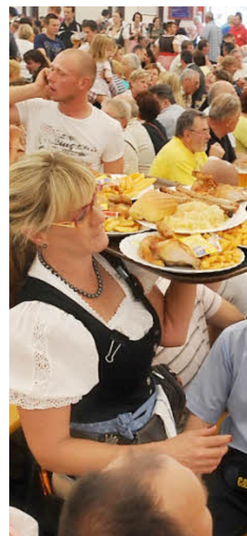
Eine gute Unterlage ist wichtig.