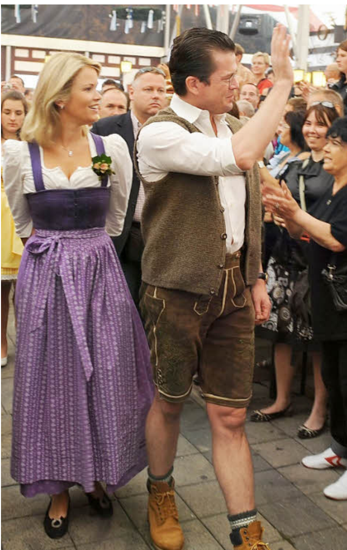
Bundesverteidigungsminister Karl-Theodor zu Guttenberg und seine Frau Stephanie genossen das Bad in der Menge.