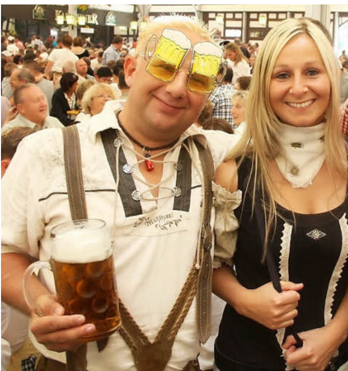
Der richtige Durchblick macht's.