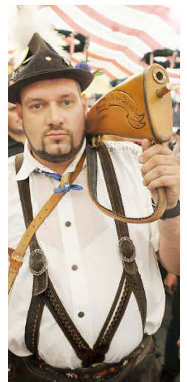
Böllerschütze nach der Arbeit.