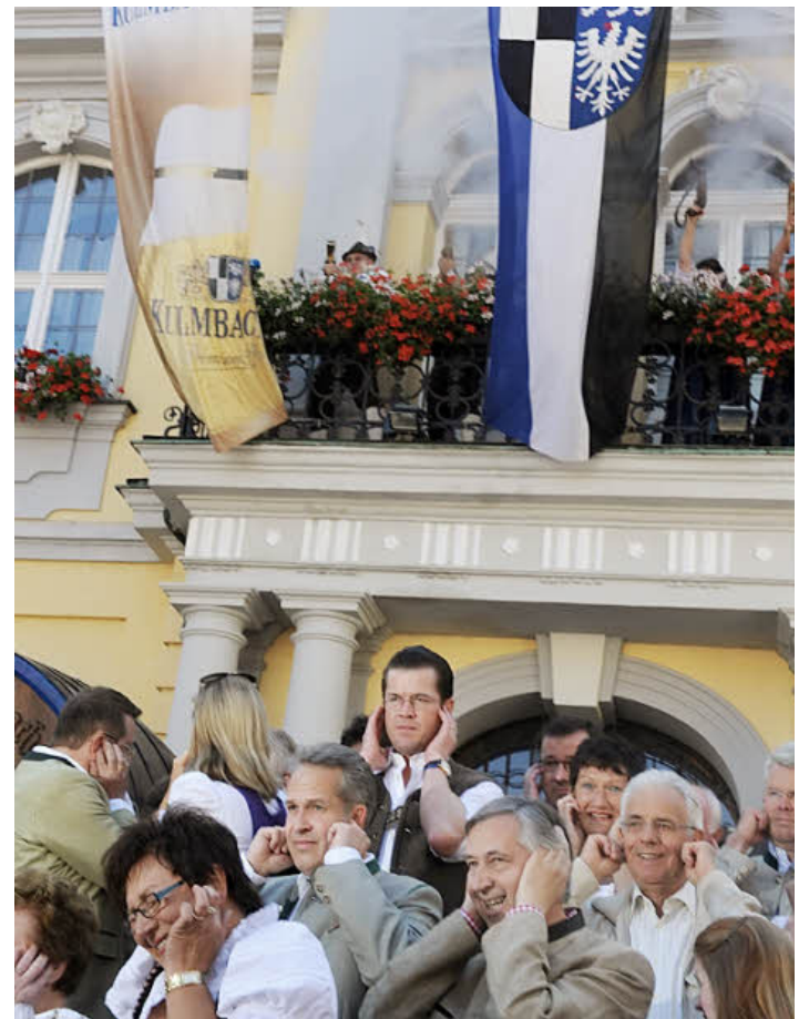
Das beste Mittel, wenn die Bischofsgrüner Böllerschützen auf der Rathausstreppe durchladen und abdrücken, lautet: Ohren zuhalten und durch!