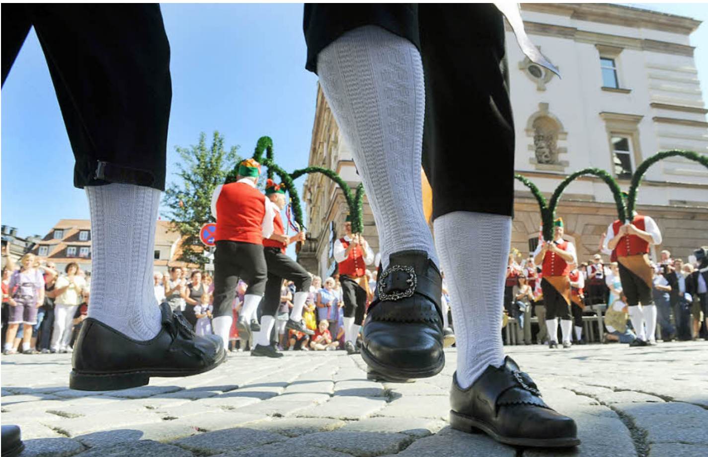
Bei echtem Kaiserwetter genossen unzählige Schaulustige bereits eine Stunde vor dem offiziellen Bieranstich das bunte Treiben auf dem Marktplatz. Die Kulmbacher Büttner zeigten ihren schwungvollen Tanz, die Stadtkapelle lieferte die schmissige Musik dazu, und die Bischofsgrüner Böllerschützen ließen es wieder mächtig krachen.