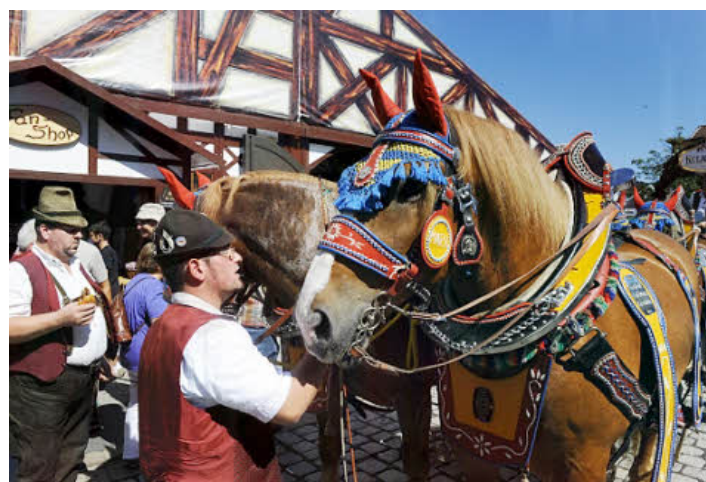
Ein prächtiges Pferdegespann konnte am Samstag bestaunt werden.