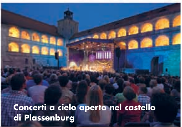
Concerti a cielo aperto nel castello di Plassenburg