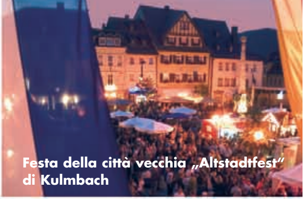
Festa della città vecchia „Altstadtfest“ di Kulmbach

Come è imperturbabile il castello di Plassenburg altresì è il calendario delle festività della città di Kulmbach. I cittadini di Kulmbach amano le loro feste. Soprattutto nei mesi estivi viene offerto sempre qualcosa. Dalla festa della città vecchia di Kulmbach, ai concerti a cielo aperto nel bellissimo cortile del castello di Plassenburg fino alla settimana della birra di Kulmbach. Le festività sono sempre un particolar modo di vivere. Un'allegria socievolezza in tutte le stagioni – i cittadini di Kulmbach sanno come festeggiare le feste e vi invitano a partecipare cordialmente.